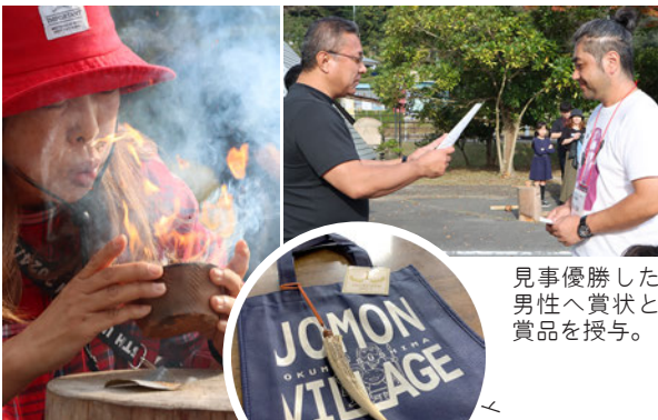
見事優勝した男性へ賞状と賞品を授与。

今年のメインイベント「火おこしNo.1決定戦！」は、初のトーナメント形式で開催！エントリーした20名が2ブロックに分かれ予選を行ったのち、上位8名で決勝戦。出場者も応援も熱が入り、熱い戦いが繰り広げられました。