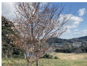
4月上旬の史跡公園。