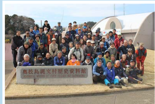
北海道から四国まで、全国から駆けつけてくれた皆さん。